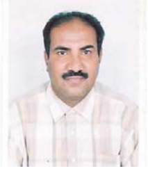
أ.د. محمد عاشور الكثيري مدير مركز النخيل والتمور